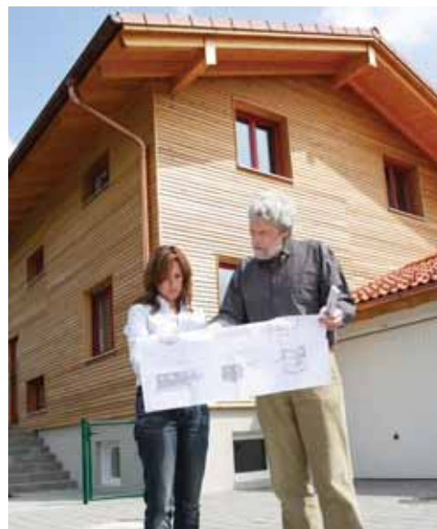
Wer neu baut, sollte sich vom unabhängigen Sachverständigen baubegleitend beraten lassen. Das schützt vor Überraschungen und Mängeln.

Das gilt auch für die Barrierefreiheit: Rollstuhlfahrer brauchen Rampen – das ist heutzutage auch Menschen bewusst, die nicht selbst Rollstuhl fahren. Doch anders als viele denken, reichen breite Türen und Rampen nicht aus, um Barrierefreiheit für alle Menschen zu schaffen. Stufen und Schwellen behindern den Weg ins Bad oder auf den Balkon. Insbesondere zum Bad sollte es keine Stufen und Schwellen geben. Wenn in der Küche die Möblierung sorgfältig geplant wird, hän-