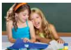
Schulstart: Veränderungen sind angesagt.

Die ersten Wochen sind wichtig für das Zusammenwachsen eines Klassenverbandes und das Vertrauensverhältnis zwischen Schülern und Lehrern.