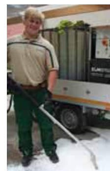
Mit einer Lanze bringt ein Grünwert-Mitarbeiter Heißwasser und Schaum auf: Damit geht es den Wildkräutern als zelleiweiß und „ans Leben“.

Dieses Problem haben nicht nur private Eigentümer von Grünanlagen und Stellplätzen, es besteht auf Friedhöfen ebenso wie im öffentlichen Verkehrsraum, bei Schulen und Kindergärten. Zweimal im Jahr griffen bislang auch die Bettinghauser „Rentner“ zur Hacke und sorgten dafür, dass der Kapellenplatz „geputzt“ wurde: Die