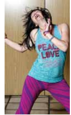
Zumba ist eine ganz besondere Bewegungsform, ein Tanz als Fitnessprogramm, der keine definierten Abläufe vorgibt, sondern auf besondere Bewegung setzt.

„Zumba ist ein Tanz-Fitnessprogramm ohne Partner für alle, die lateinamerikanische