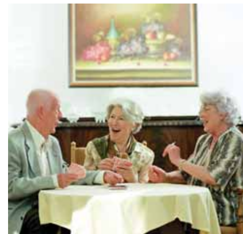
Das Leben im Alter muss gut vorbereitet werden. Mögliche Einschränkungen sollten rechtzeitig bedacht und geregelt werden.

Kaum jemand macht sich in der Mitte des Lebens Gedanken darüber, wie sie oder er später einmal leben will. Aber gerade im Alter hat die Wohnqualität entscheidenden Einfluss auf Lebensfreude, Sozialkontakte und das allgemeine Wohlbefinden. Ein langes Leben in guter Gesundheit wünscht sich wohl jeder. Doch die Realität schaut leider oft anders aus. Kann der Pflegebedürftige zuhause gepflegt werden oder be-