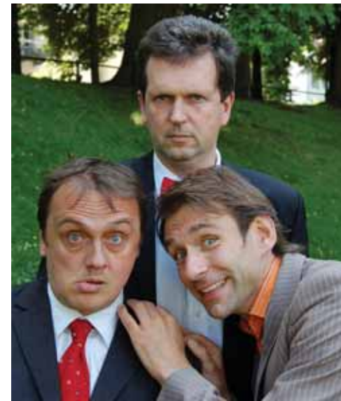
Storno steht für satirische Feinkost aus besten Zutaten der letzten zwölf Monate – abgemischt zu einem hochprozentigen Cocktail aus intelligenter Analyse.

Am 7. März kommt Jürgen Becker und präsentiert „Der Künstler ist anwesend“. Becker macht Kunst, Jürgen Becker ist gemeint. Kabarettisten kann man nicht übers Sofa hängen. Wenn man's doch tut, passt er womöglich